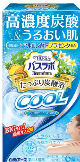
HERSバスラボクール プレミアム たっぷり炭酸浴 サマーアロマ6錠入

夏にピッタリの4つの香りを詰め合わせ、お湯色も「透明湯タイプ」と「にごり湯タイプ」の2種類あるので、その日の気分でお楽しみいただけます。