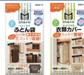
衣類・収納空間ケア

消費者の方のお問い合わせ 白元アース株式会社 お客様相談室 TEL 03-5681-7691