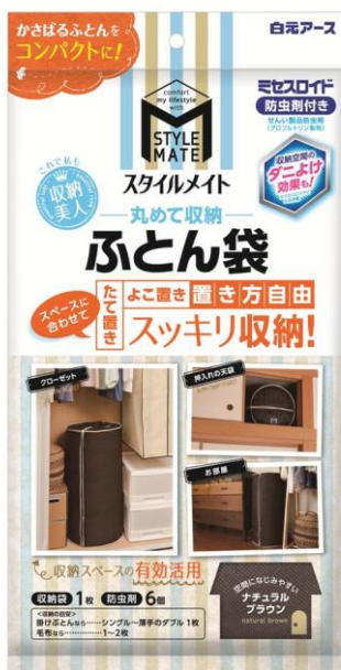
ミセスロイド スタイルメイト 丸めて収納 ふとん袋

また、ミセスロイド引き出し用(防虫剤)付きで、虫食いだけでなく、ミセスロイドの機能である収納空間のダニよけ効果により大切なふとんを守ります。「おとりかえサイン」が出たら『ミセスロイド引き出し用』を取り替えることで、くり返し使用できます。