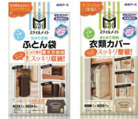
衣類・収納空間ケア

消費者の方のお問い合わせ 白元アース株式会社 お客様相談室 TEL 03-5681-7691