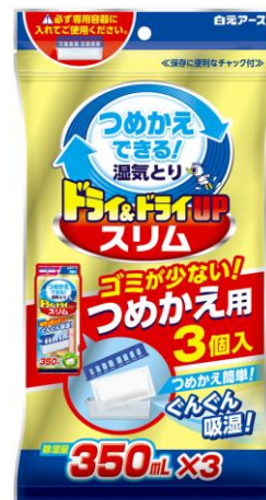
ドライ&ドライUPスリム つめかえ用3個入