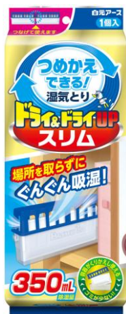
ドライ&ドライUPスリム 容器付き