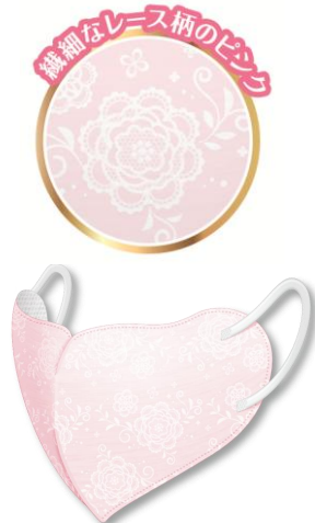
be-style UVカットマスク シャインピンク