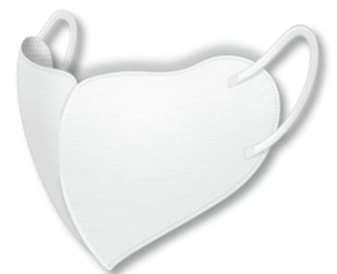
be-style UV カットマスク ホワイト